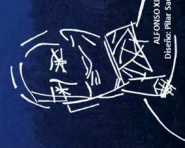
ALFONSO XIII Diseño: Pilar Sauguet

Ruta incluida en la Liga de Senderismo FEDME